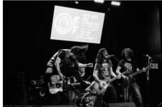
Les Trimpes, crédit : Nicolas Padovani