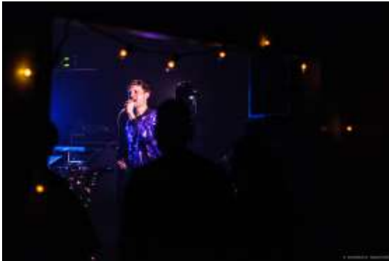
Radiant Baby, crédit : Jacques Boivin