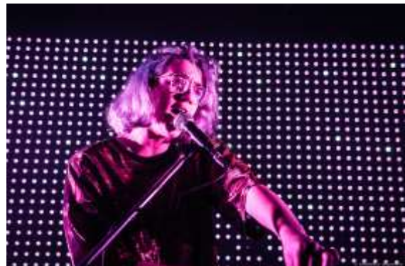
Fria Moeras