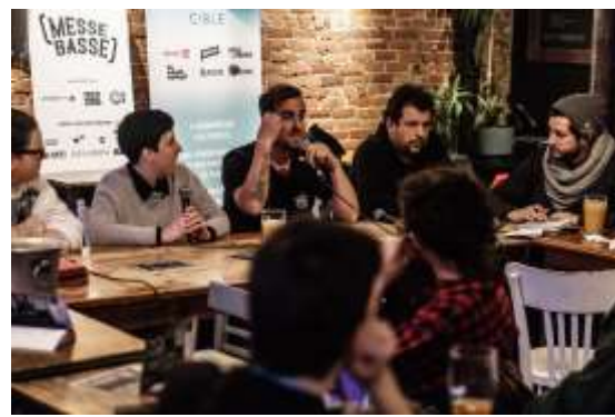
Messe Basse