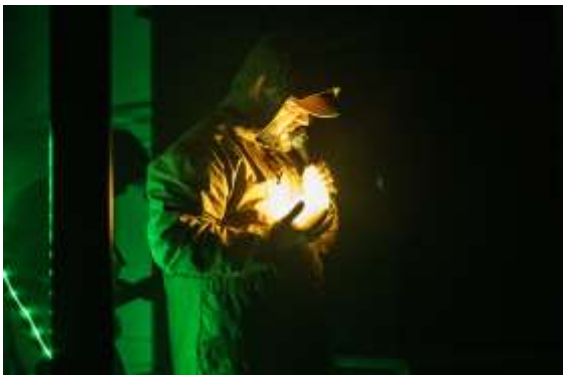
Mudie, crédit : Marie-Ève Fortier